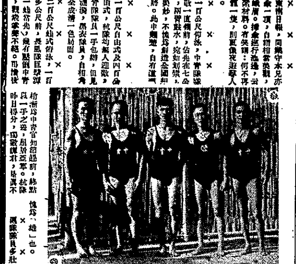
（攝于友稿） 砲隊演：一之目面演演軍中