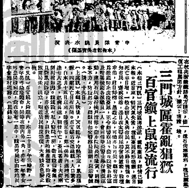
（攝于友稿） 砲隊演：一之目面演演軍中