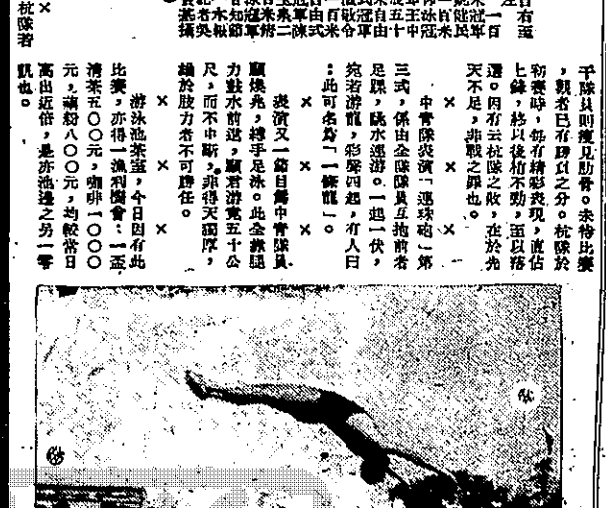
（攝于友稿） 砲隊演：一之目面演演軍中