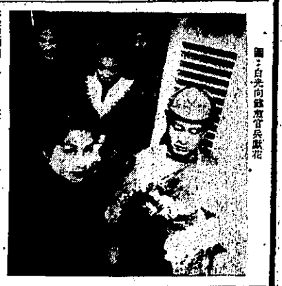
白光向駐滬英領事致歉